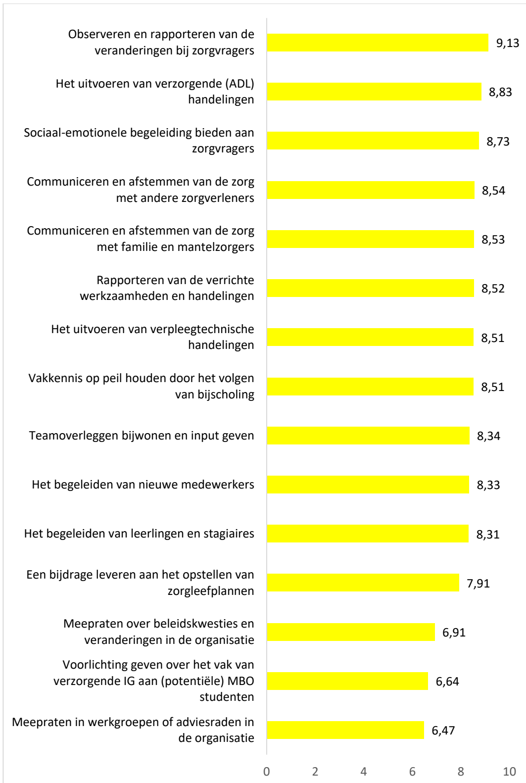
Figuur 1. Hoe belangrijk is een taak in het vak van verzorgende IG?