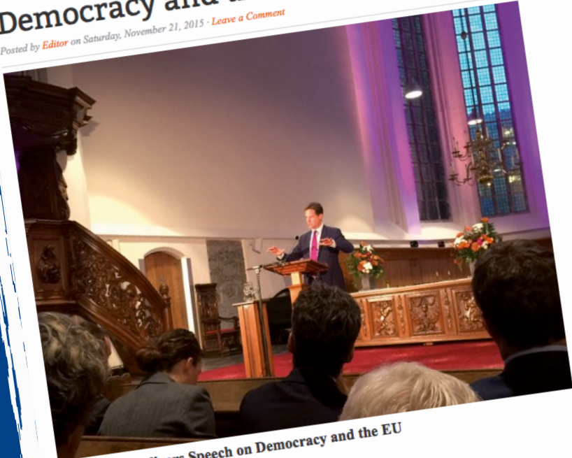
Nick Clegg Delivers Speech on Democracy and the EU

Posted by Editor on Saturday, November 21, 2015 · Leave a Comment