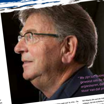
"We zijn tot dusverre niet geweest om de democratische organisaties, dat de burgerstuurt van dat proces zit."

"De maatschappelijke dynamiek is nu zo aan het veranderen - er is een permanente technologische revolutie er hingend achteraan lopen."