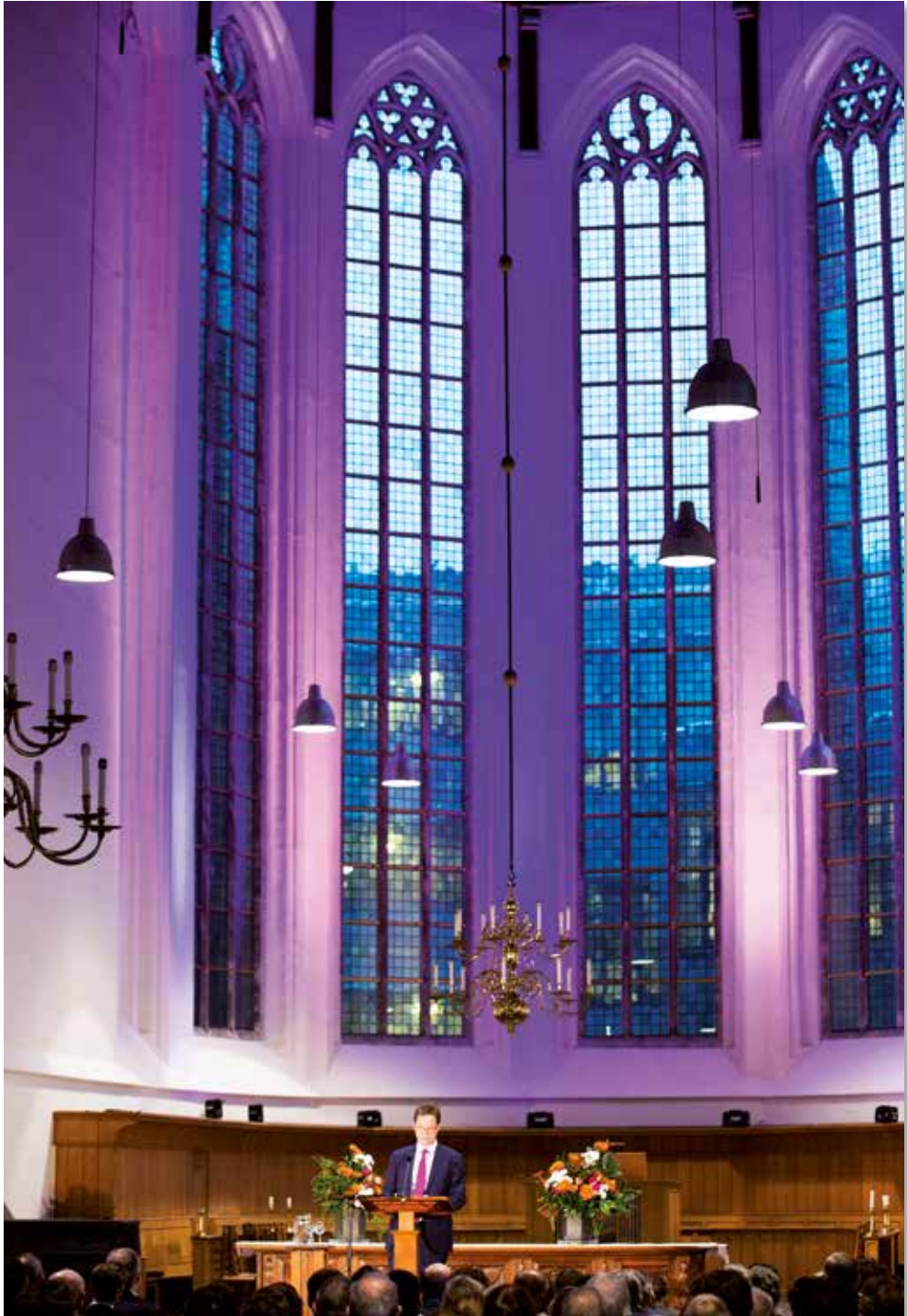
Rob-lezing 2015.