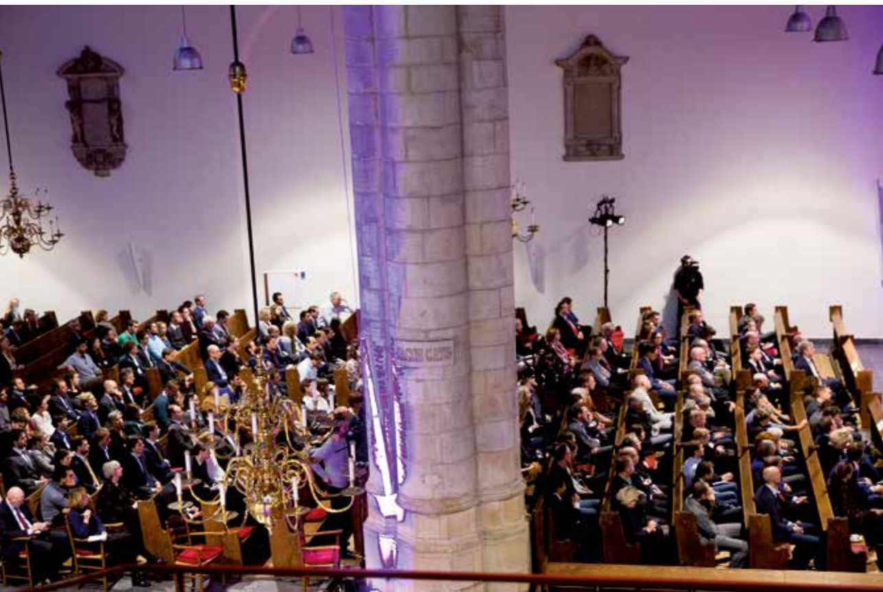
Rob-lezing 2015.

Op initiatief van de Tweede Kamer heeft minister Plasterk van Binnenlandse Zaken en Koninkrijksrelaties de Raad voor het openbaar bestuur gevraagd te adviseren over de democratische legitimiteit van samenwerkingsverbanden.