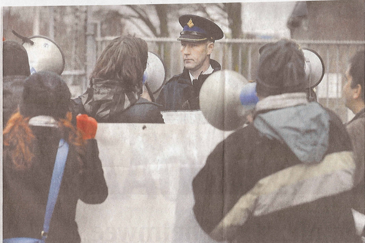
De Anti Dierproeven Coalitie protesteert in januari 2008 bij proefdierfokkerij Harlan in Horst. De politie voorkomt dat activisten het terrein opgaan.

voldoende opkwamen voor de kwaliteit en erkenning van het werk in de verpleging. Meer recent ontstond de vereniging Beter Onderwijs Nederland, die op de bres staat voor een beter middelbaar onderwijs.