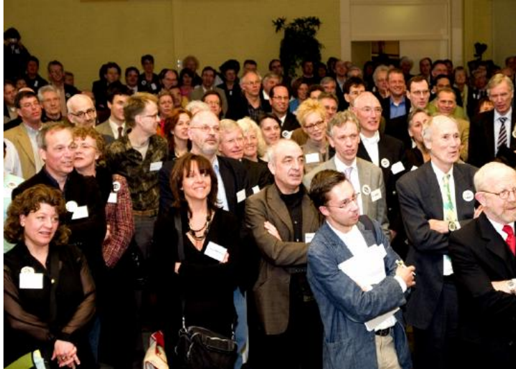
In de aula van het Mondriaan College tijdens de Conferentie Van BeroepsZeer naar BeroepsEer op 7 april 2006